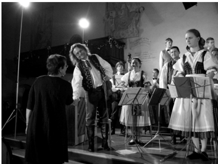
Vycpálkovci se nikoli poprvé postarali o přitažlivý doprovod nejen při Paschové Vianočné omši.