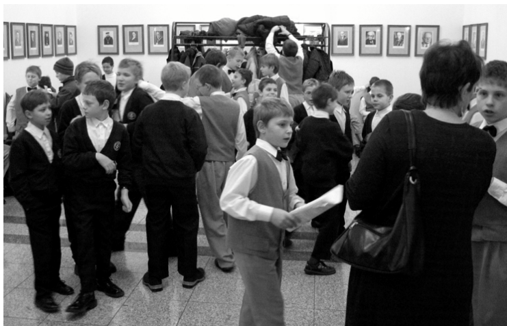
Pueri gaudentes se připravují na koncert s Vycpálkovci v prosinci 2004.